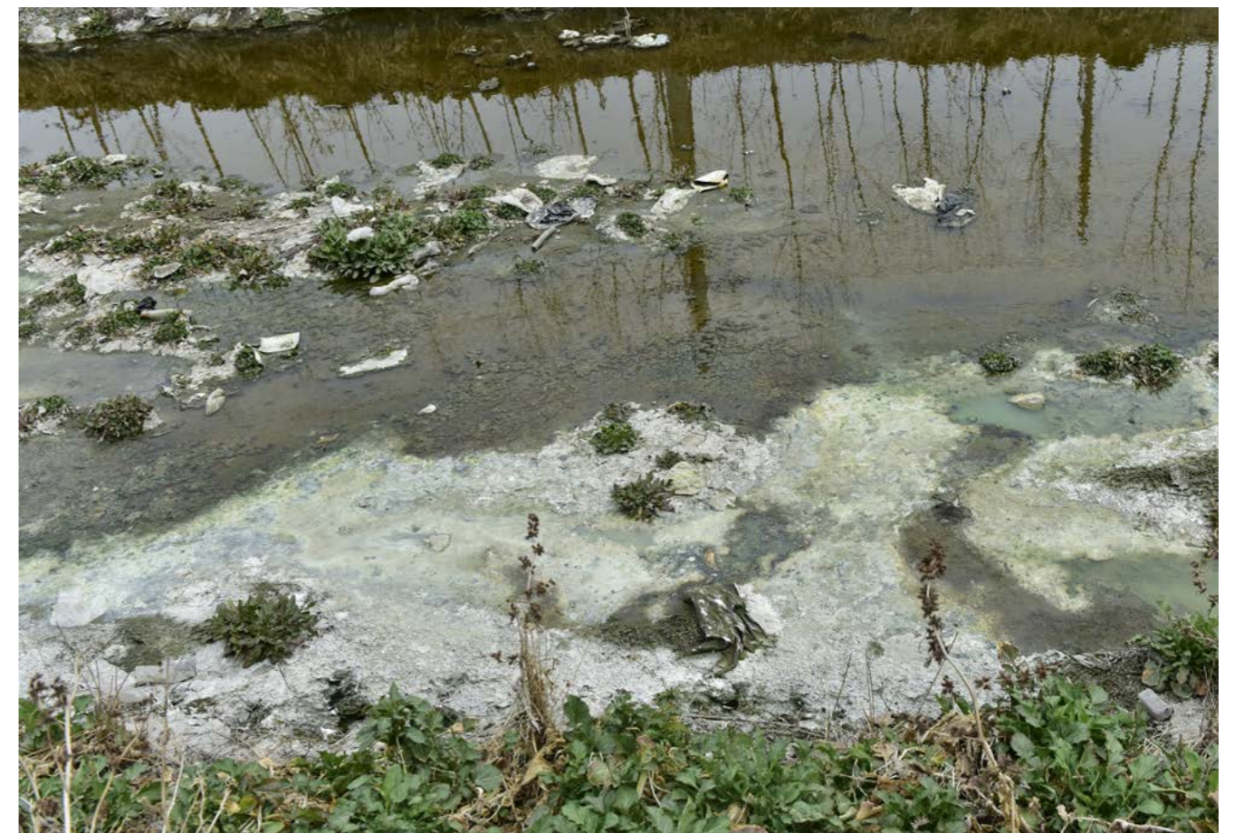
Agua contaminada en el río Beijiao Xinhe, cerca de la fábrica Shandong Silver Hawk (China).